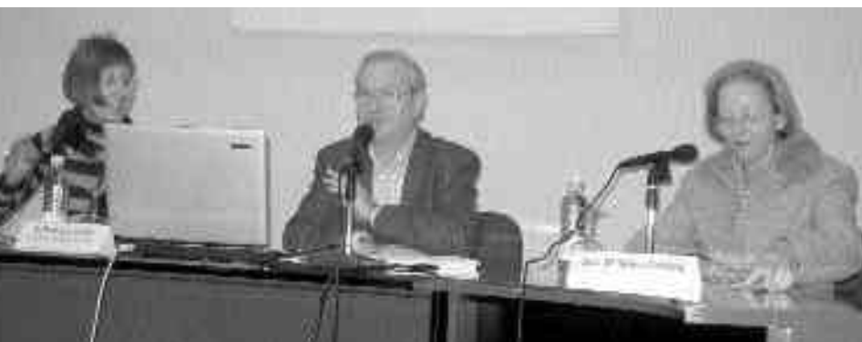
IMATGE D'UNA DE LES ACTIVITATS DE L'ESCOLA.

Des de l'Escola es recorda que "el món és global i ha de ser reconstruït per totes les persones que l'habiten".