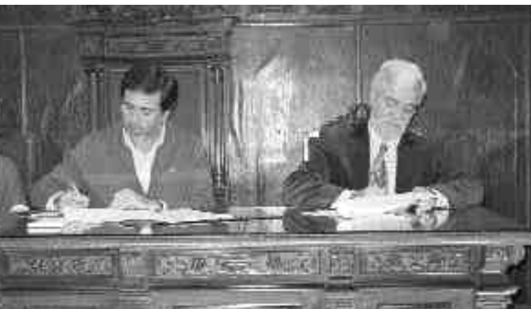
EL ALCALDE Y EL PRESIDENTE DE FEVECTA ATENDIERON A LOS MEDIOS DE COMUNICACIÓN LOCAL AL TÉRMINO DE LA FIRMA DEL CONVENIO.