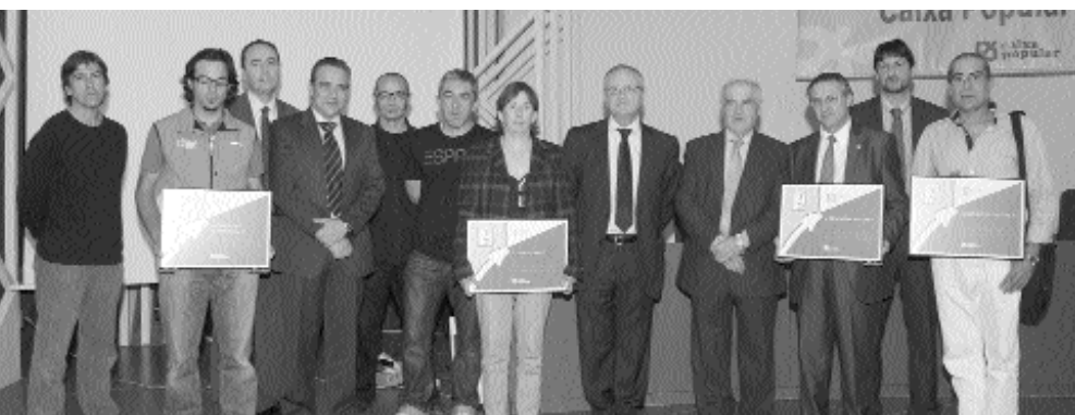
FOTO DE LOS GALARDONADOS EN LOS PREMIOS A LA GESTIÓN INNOVADORA Y A LA INNOVACIÓN PEDAGÓGICA DE CAIXA POPULAR.