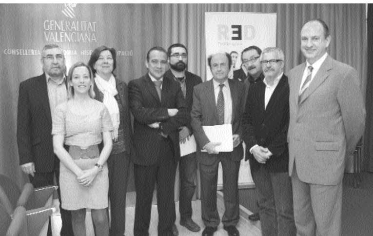
FOTO DE FAMÍLIA DESPRÉS DE LA FIRMA DE L'ACORD ENTRE ELS MEMBRES DE LA RED EMPRENDES, SINDICATS UGT I CC.OO I CIERVAL,